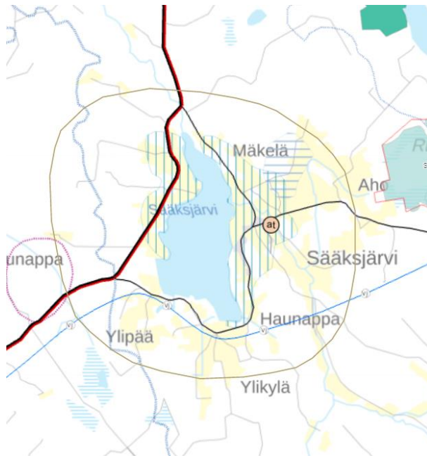
Kuva 3. Ote Etelä-Pohjanmaan maakuntakaavasta.

Suunnittelualue sijoittuu maakuntakaavan laajalle Kruunupyynjoen valuma-alueen turvetuotantovyöhykkeelle (tt-1) ja maaseudun kehittämisen kohdealueelle (mk-1). Suurin osa suunnittelualueesta on myös osoitettu kulttuuriympäristön tai maiseman vaalimisen kannalta tärkeäksi alueeksi (ma, Sääksjärven maisemakokonaisuus).