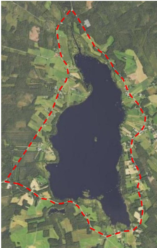
Kuva 2. Suunnittelualueen likimääräinen rajausta ja ortokuva alueesta.