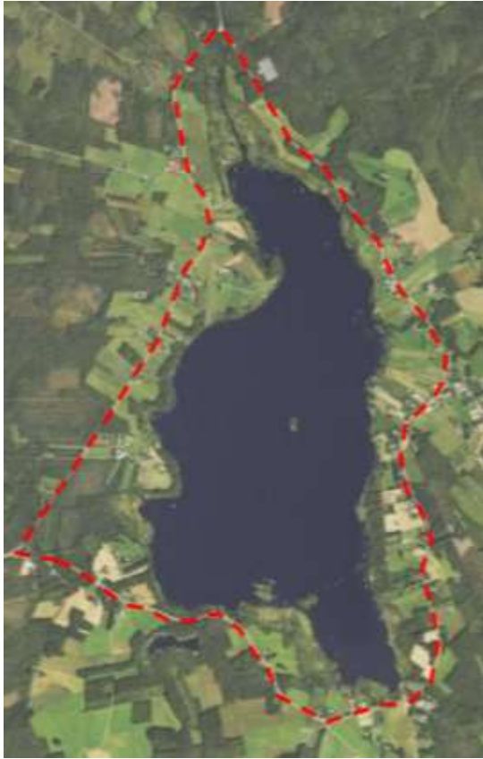
Kuva 2. Suunnittelualan likimääräinen raja ja ortokuva alueesta.