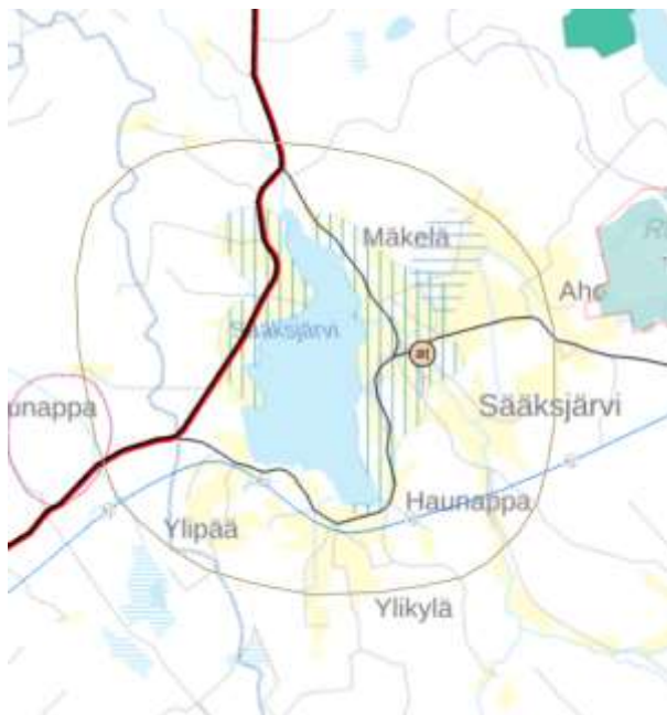
Kuva 3. Ote Etelä-Pohjanmaan maakuntakaavasta.

Suunnittelualue sijoittuu maakuntakaavan laajalle Kruunupyynjoen valuma-alueen turvetuotantovyöhykkeelle (tt-1) ja maaseudun kehittämisen kohdealueelle (mk-1). Suurin osa suunnittelualueesta on myös osoitettu kulttuuriympäristön tai maiseman vaalimisen kannalta tärkeäksi alueeksi (ma, Sääksjärven maisemakokonaisuus).